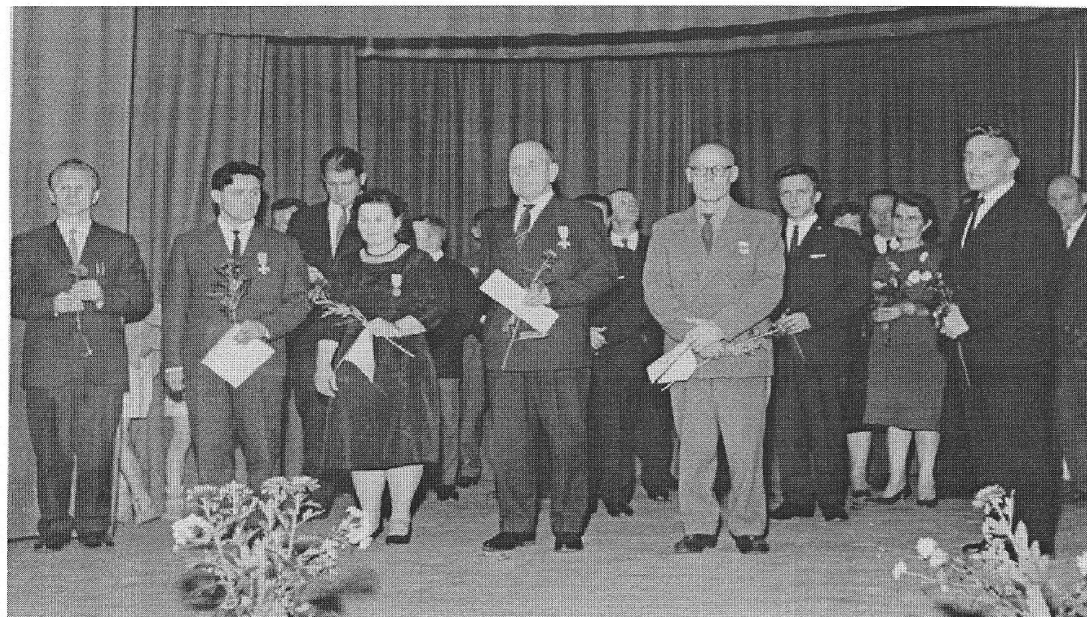
20v Juhla 1962.