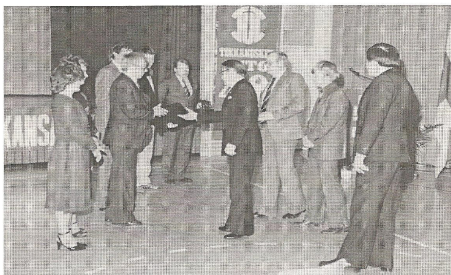
Onnittelemassa Jyväskylän Toverit.