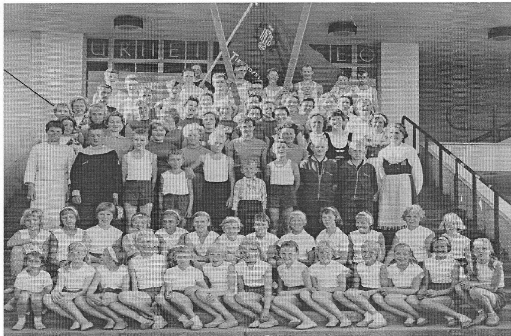
Liitjuhlia Olympiastadionilla Helsingissä 1959.