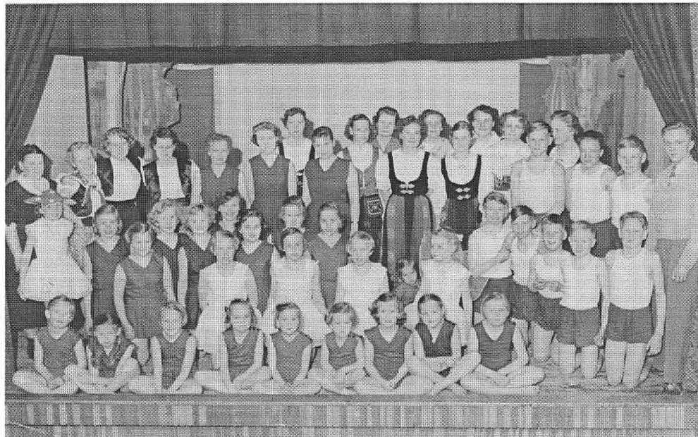
Liittojuhlan kenraali Tikanmajalla 1954.