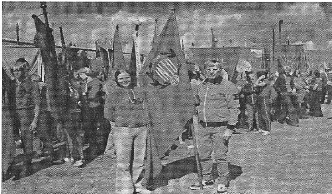
Urheilujuhla 1974, Lahti