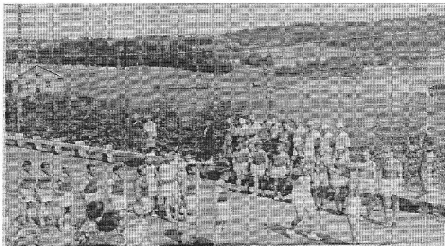
Olympiasoihdun kuljetus 1952.