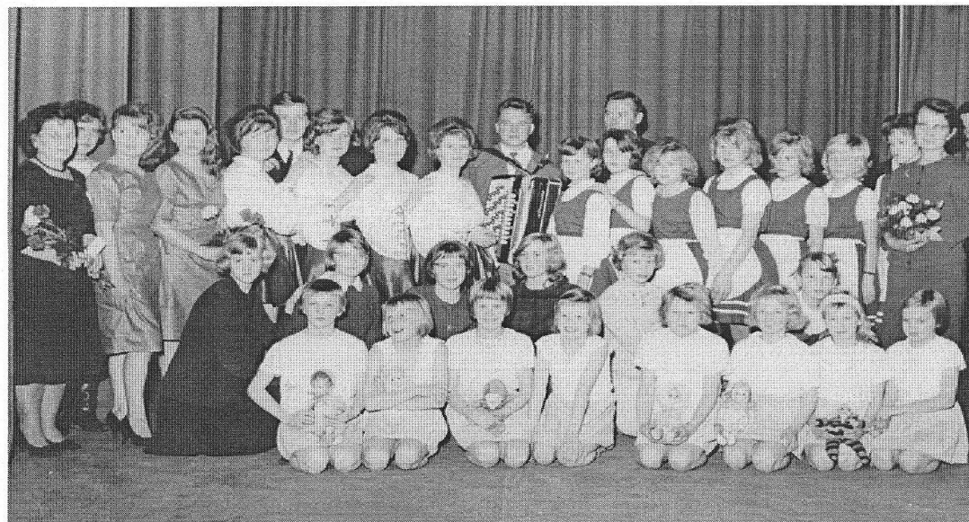
20v Juhla 1962