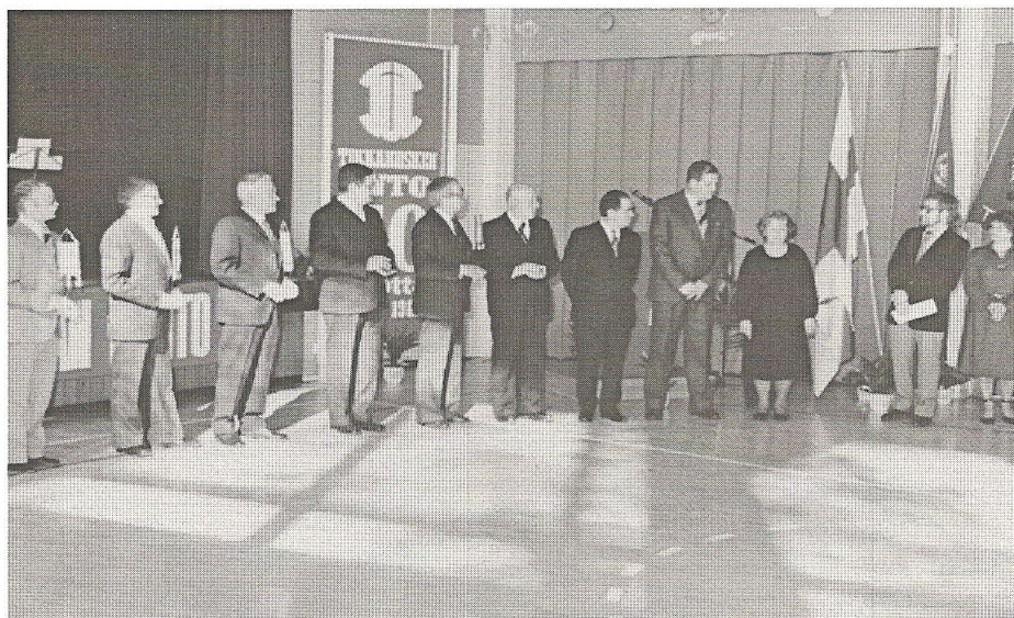
Ansiotuneet Innon veteraanit.